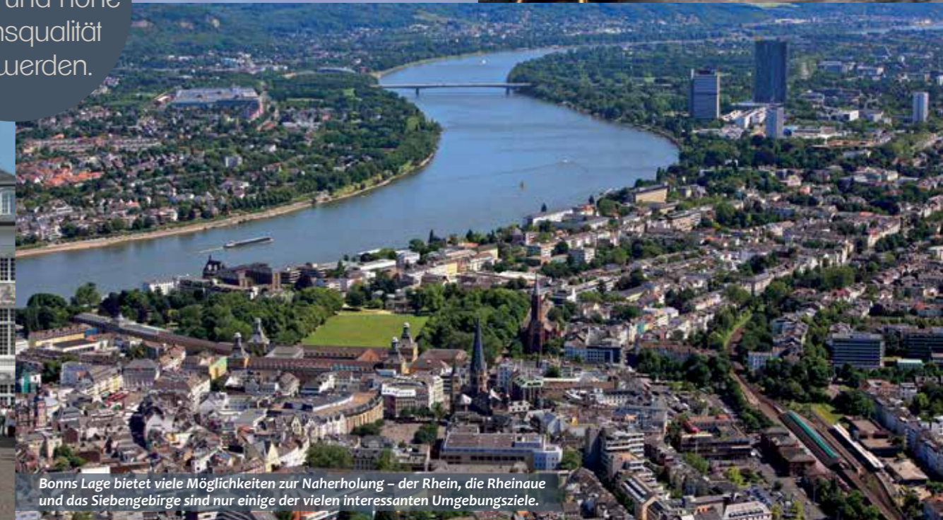
Bonns Lage bietet viele Möglichkeiten zur Naherholung – der Rhein, die Rheinaue und das Siebengebirge sind nur einige der vielen interessanten Umgebungsziele.