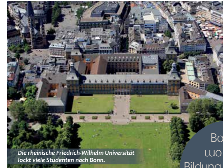
Die rheinische Friedrich-Wilhelm Universität lockt viele Studenten nach Bonn.

Mit ihrer ausgezeichneten Lage und der exzellenten Infrastruktur ist die Stadt am Rhein nicht nur regional, sondern auch international bestens angebunden. Dafür sorgen ein dichtes Autobahnnetz, die Schnellzug-Anbindung und nicht zuletzt der schnell erreichbare Flughafen Köln/Bonn.