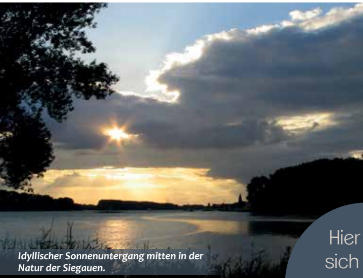
Idyllischer Sonnenuntergang mitten in der Natur der Siegauen.