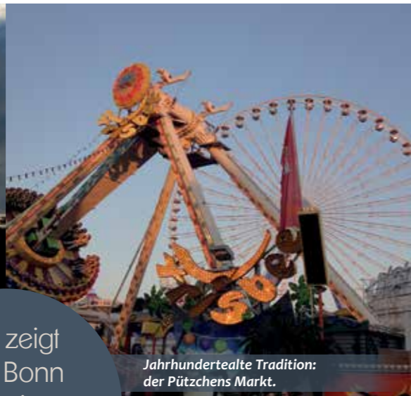
Jahrhundertealte Tradition: der Pützchens Markt.