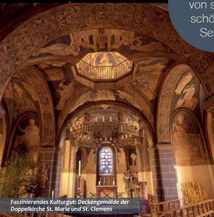
Faszinierendes Kulturgut: Deckengemälde der Doppelkirche St. Maria und St. Clemens

Hier zeigt sich Bonn von seinen schönsten Seiten.