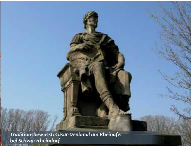
Traditionsbewusst: Cäsar-Denkmal am Rheinufer bei Schwarzrheindorf.

Hier zeigt sich Bonn von seinen schönsten Seiten.