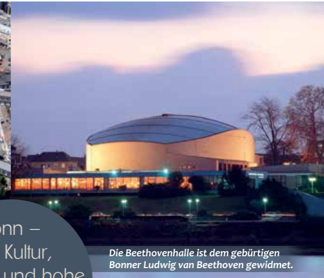
Die Beethovenhalle ist dem gebürtigen Bonner Ludwig van Beethoven gewidmet.