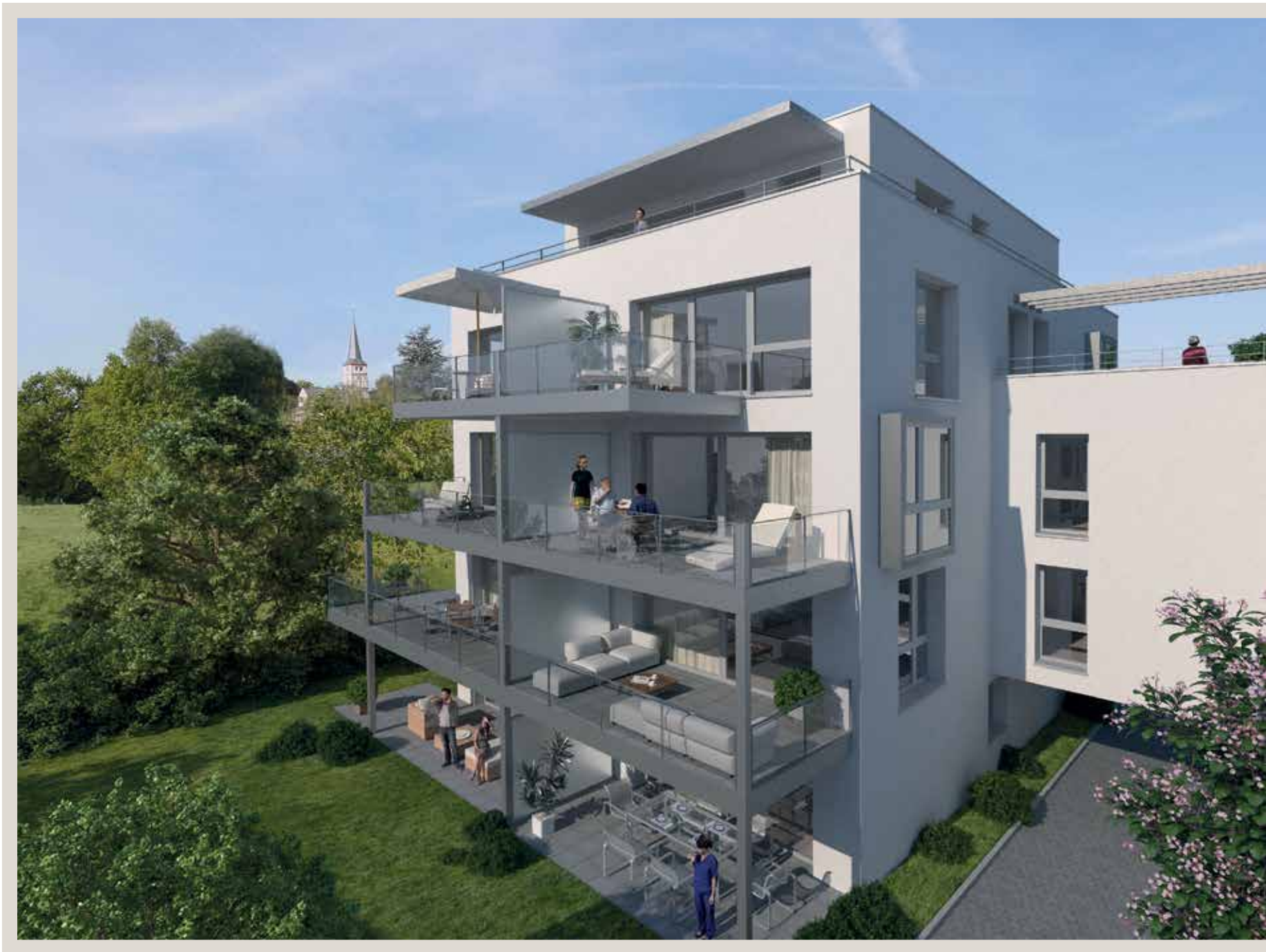
Die Sonnenseite Bonns – exklusives Wohnen an den Beueler Rheinwiesen in Schwarzrheindorf