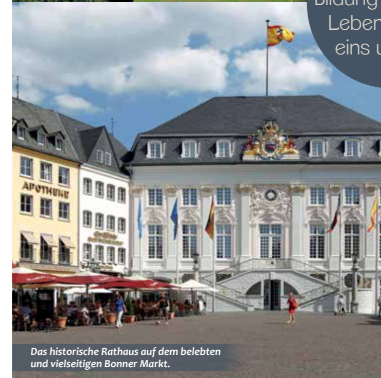
Das historische Rathaus auf dem belebten und vielseitigen Bonner Markt.

Bonn – wo Kultur, Bildung und hohe Lebensqualität eins werden.