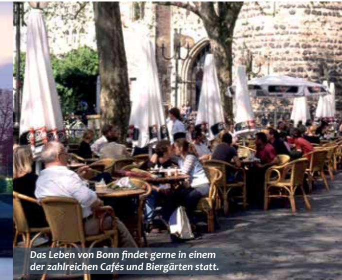
Das Leben von Bonn findet gerne in einem der zahlreichen Cafés und Biergärten statt.

Bonn – wo Kultur, Bildung und hohe Lebensqualität eins werden.