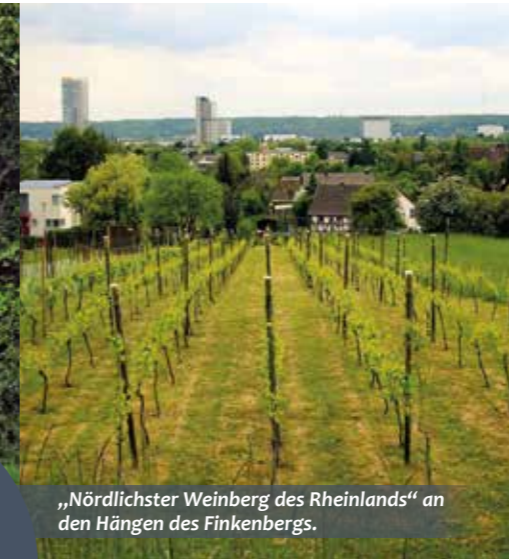
„Nördlichster Weinberg des Rheinlands“ an den Hängen des Finkenbergs.

Hier zeigt sich Bonn von seinen schönsten Seiten.