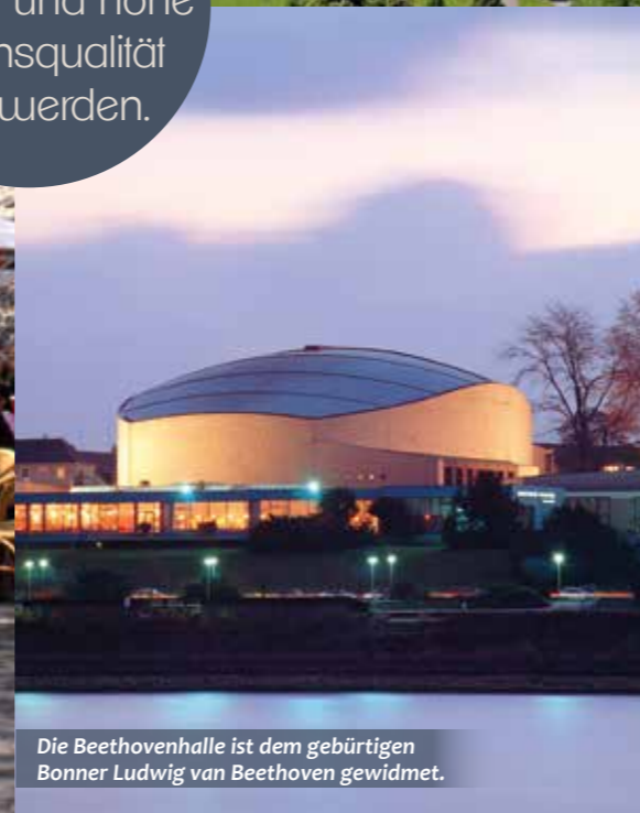
Die Beethovenhalle ist dem gebürtigen Bonner Ludwig van Beethoven gewidmet.