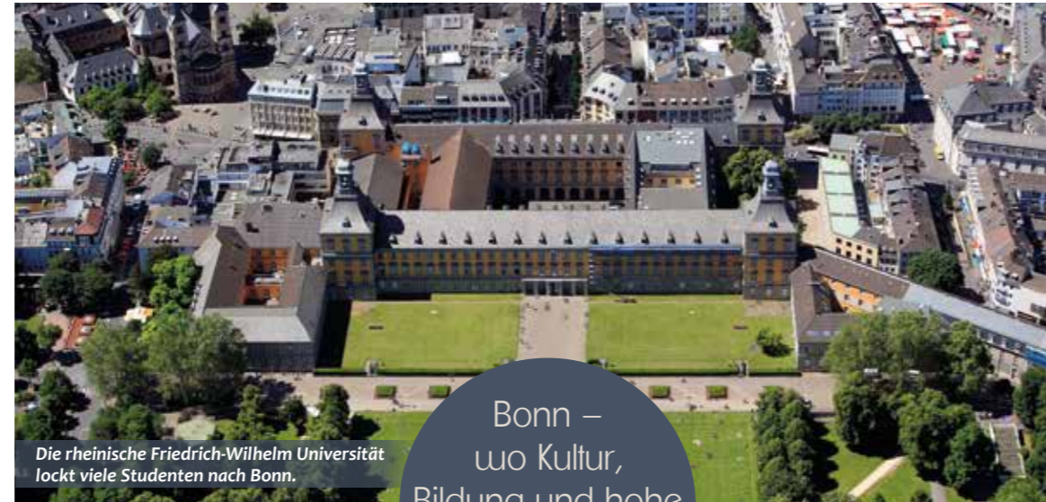
Die rheinische Friedrich-Wilhelm Universität lockt viele Studenten nach Bonn.

Die Museumsmeile – u. a. mit dem Deutschen Museum Bonn und dem Haus der Geschichte – ist Anziehungspunkt für Kunst- und Kulturinteressierte aus aller Welt. Zudem locken die Oper Bonn und das Schauspiel mit den Kammerspielen Bad Godesberg sowie der Schauspielhalle Beuel. Auch zwei renommierte Kabarett- und Kleinkunsthäuser haben in Bonn ihr Zuhause. Schließlich ist die Stadt am Rhein nicht nur regional, sondern auch international bestens angebunden. Dafür sorgen ein dichtes Autobahnnetz, die Schnellzug-Anbindung und der zügig erreichbare Köln Bonn Airport.