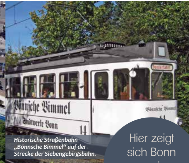
Historische Straßenbahn „Bönnsche Bimmel“ auf der Strecke der Siebengebirgsbahn.

Bonn – wo Kultur, Bildung und hohe Lebensqualität eins werden.