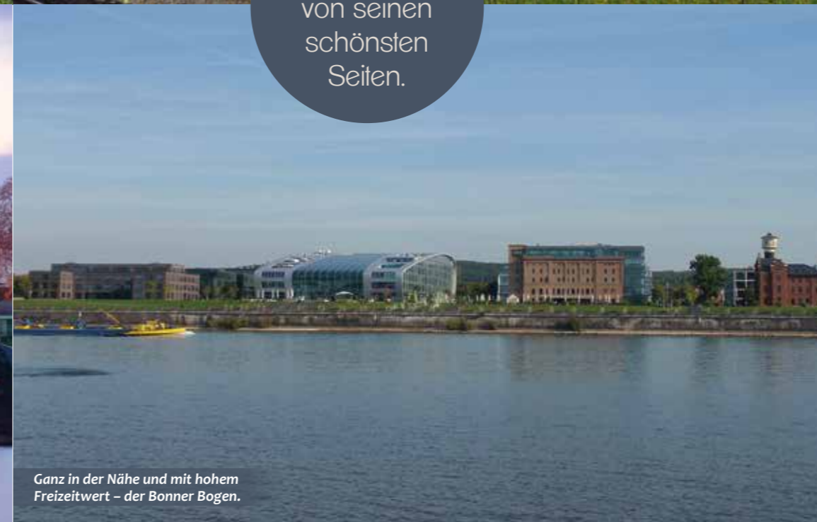
Ganz in der Nähe und mit hohem Freizeitwert – der Bonner Bogen.