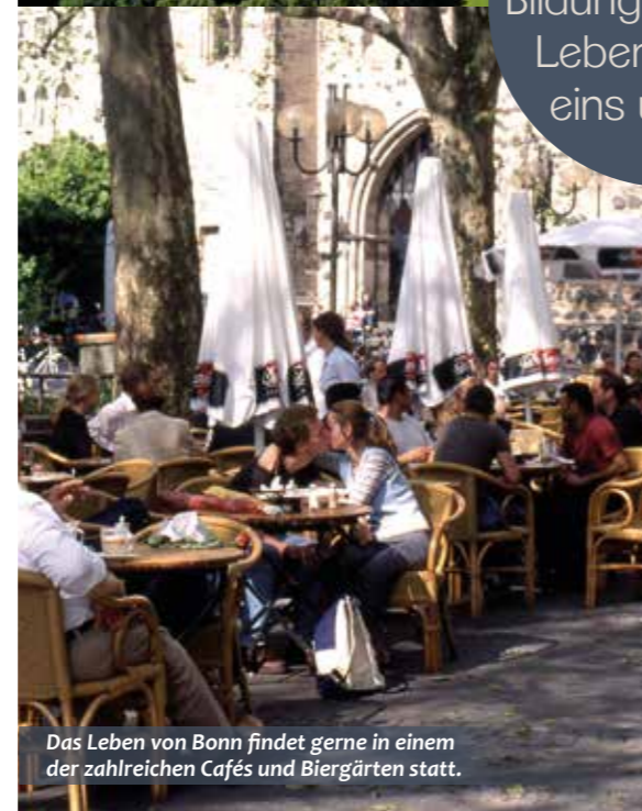
Das Leben von Bonn findet gerne in einem der zahlreichen Cafés und Biergärten statt.